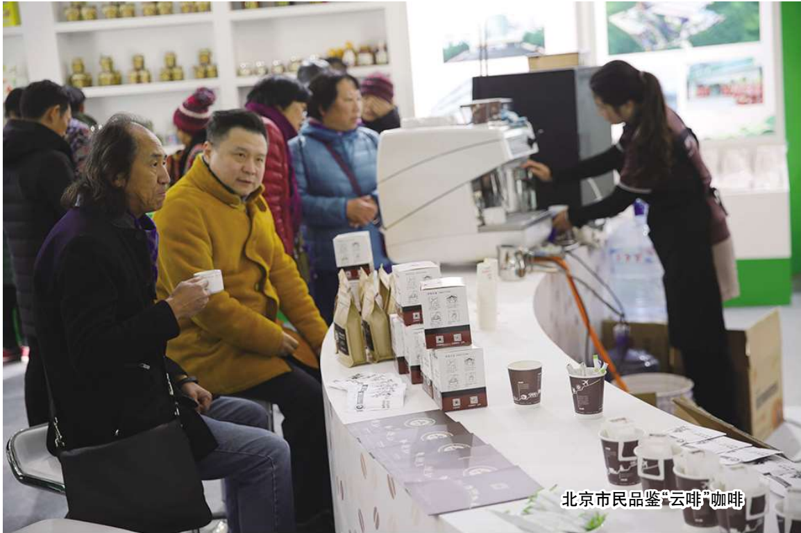
北京市民品鉴“云啡”咖啡

12月9日,“云南特色·冬农魅力”2018云南高原特色现代农业(北京)推介活动在北京全国农业展览馆落下帷幕。据统计,经过4天的展示交易,共实现现场销售额144.08万元,实际签约金额1399万元,意向签约商家164家,意向签约金额2485万元,参观总人数达5万人。 2015年,集团作为参展商参加推介活动,首次展示了集团政企分开后的新形象、新面貌;2016年,集团独立作为承办方,体现了集团作为国有大型农业企业的地位和担当;2017年,集团和省农业厅一起成为主办和承办单位,彰显了集团政企分开三年来的成绩和云南农业企业的“排头兵”地位。2018年,集团和省农业厅共同为贯彻落实省委省政府发展高原特色农业、打造世界一流“绿色食品品牌”的安排部署,再次担当起云南“绿色食品品牌”推荐官的重任,进一步打造和推广云南高原特色农产品品牌,在中央相关部委、省农业厅、云南农业企业及北京采购商、消费者心中巩固了云南现代农业发展领军企业的地位和形象。