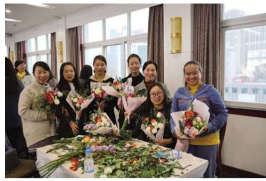
集团总部、各二级企业开展三八妇女节系列活动

管权管事管人，严格落实好集团公司《关于进一步加强党员干部职工监督管理的实施意见》和《中层副职以上领导干部因公因私外出审批报备管理办法》。 会上，集团公司党委副书记、工会主席陈云忠，党委委员、副总经理孔君，国际业务总监、纪委副书记唐盛军三位同志分别结合《中共中央关于加强党的政治建设的意见》《中国共产党重大事项请示报告条例》和分管工作实际作了研讨交流发言。 会议还专门邀请了省委党校教授对习近平新时代中国特色社会主义思想关于高质量发展的重要内容进行了专题辅导，集团总部各部门正副职领导人员参加了专题辅导。（李献发）